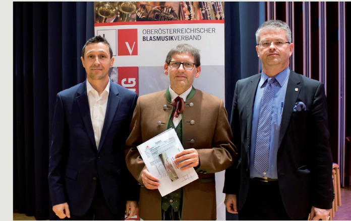
Ein sichtlich zufriedener Dirigent bei der Ergebnis-Präsentation der Konzertwertung.

Mit dem Pflichtstück „Ouvverture Royale“ (Reinhard Summerer) und dem Selbstwahlstück „Des Riesen Nixe“ (Fritz Neuböck) konnten wir die dreiköpfige Jury begeistern. Wir erhielten für unsere Darbietung 140,40 Punkte in der Leistungsstufe B. Dies bedeutete für uns nicht nur ein sehr gutes Ergebnis, sondern auch die Höchstpunktzahl beider Wertungstage.